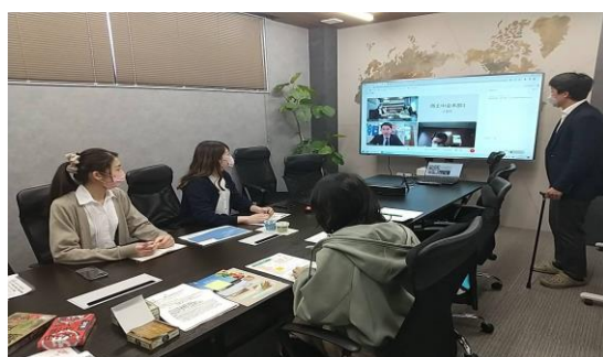
【場所：株式会社鈴木榮光堂 バイヤーの様子】

商工中金は、お客さまの課題解決に繋がる金融面のサポートに加え、地域金融機関と連携し、全国ネットワークを生かしたビジネスマッチングを通じて、お客さまの販路開拓を強力に支援してまいります。