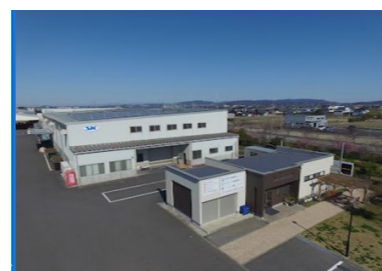
【坂田 A 棟工場】