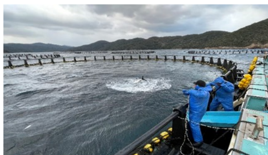
【クロマグロの生け簀】