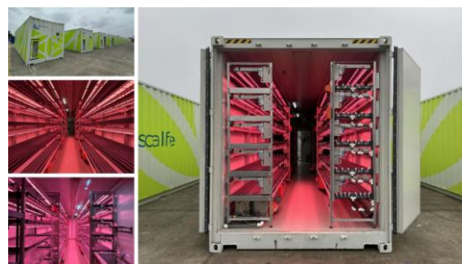
【コンテナ式植物工場】