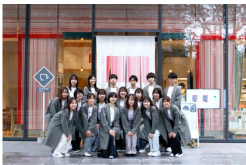
【アナザー・ジャパンで活動する学生(2期生)】