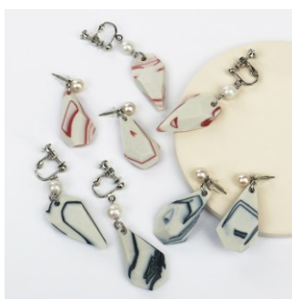
【2024年4月からの販売に向けて共同開発した新商品】