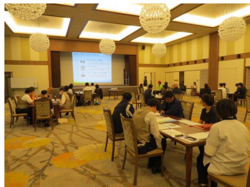
【ワークショップの様子】