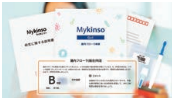
【Mykinsoサービスイメージ】